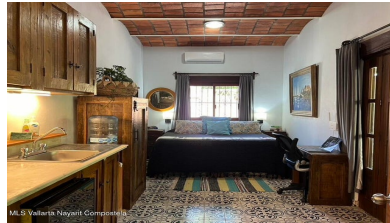
MI S Vallarta Nayariit Compostela