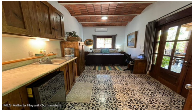
MI S Vallarta Nayariit Compostela