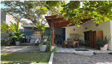
MI S Vallarta Nayariit Compostela