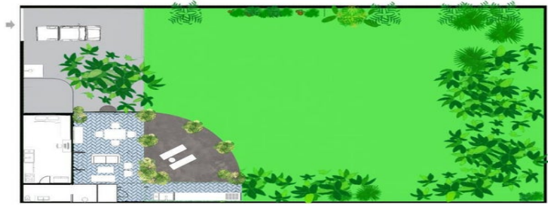
MI S Vallarta Nayariit Compostela