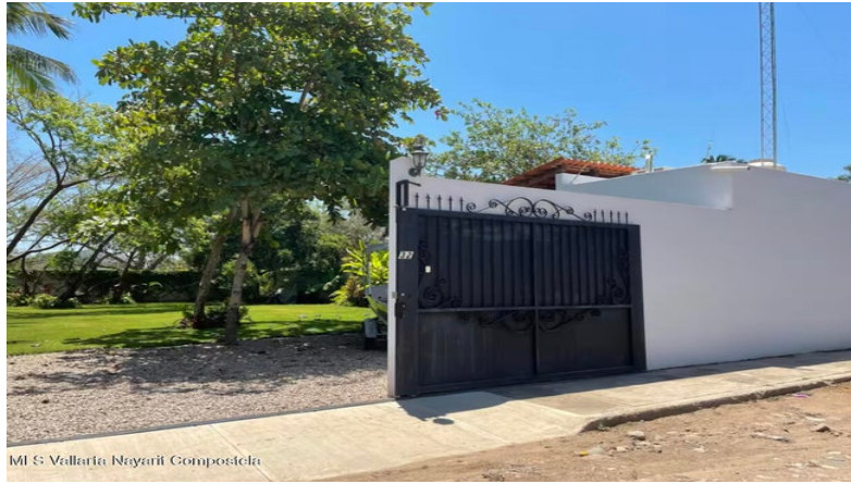
MI S Vallarta Nayariit Compostela