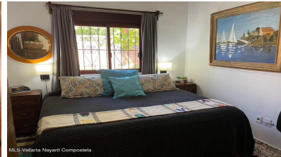
MI S Vallarta Nayariit Compostela