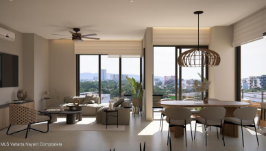
MLS Vallarta Nayariit Compostela