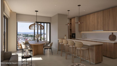
MLS Vallarta Nayariit Compostela