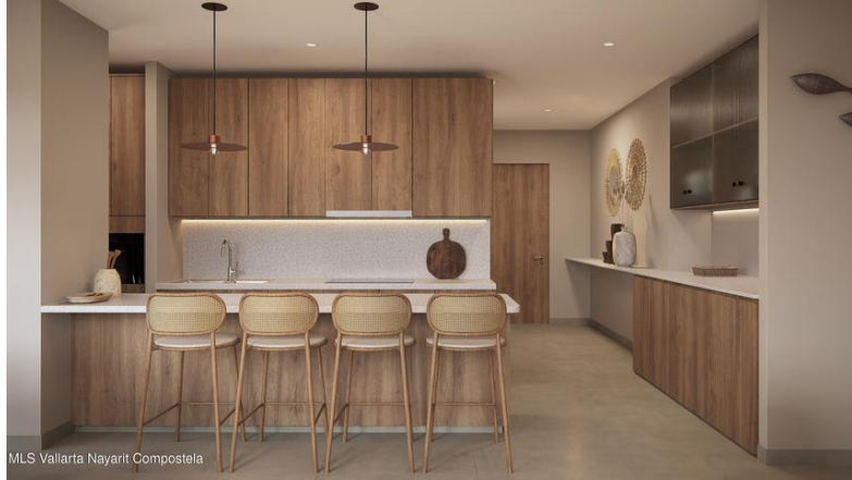
MLS Vallarta Nayariit Compostela