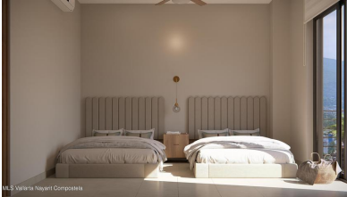
MLS Vallarta Nayariit Compostela