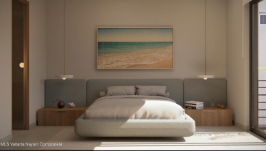
MLS Vallarta Nayariit Compostela